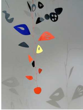
صورة (١٠٨) ألكسندر كالدر . الزهور المتتالة ، ١٩٤٩م ، نحاس

أساليب جديدة للنحات فى إبداع أشكال نحتية تنوعت فيها الصياغات التشكيلية. وهذا يبين أن الفنانين اعتادوا على أن ينتجوا أعمالهم طبقا للمفاهيم السائدة فى عصرهم، ويربطون بين الحدث الفني والآراء والقيم التي يحملها، ويعد هذا إسهاما منهم تجاه الحياة العصرية فى تمثيل القيم الإنسانية.